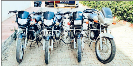
फतेहाबाद। पुलिस द्वारा गिरफ्तार वाहन चोरी के दोनों आरोपी व वाहन चोरों से बरामद किए गए मोटरसाइकिल।

पुलिस चौकी बस अड्डा में शिकायत दर्ज करवाई थी। शिकायत के अनुसार, बीती 11 अप्रैल को वह आरोपी मोटरसाइकिल पुराने बस स्टैंड के पास स्थित भारतीय स्टेट बैंक के एटीएम के पास खड़ी कर किसी काम से गया था। वापस आने पर उसकी बाइक वहां नहीं मिली। पुलिस ने इस संबंध में भारतीय न्याय संहिता की धारा 305 के तहत