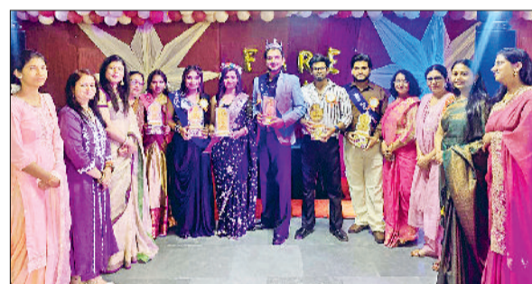
सिरसा। विभिन्न खिताबों से नवाजे गए विद्यार्थी।