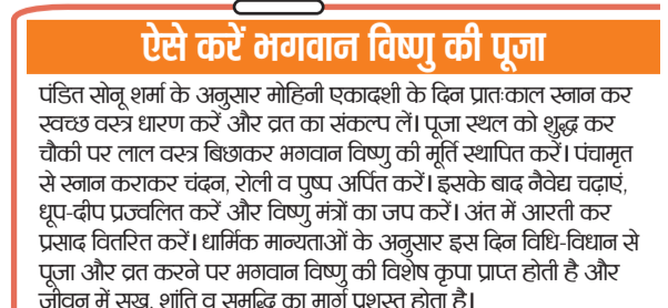
ऐसे करें भगवान विष्णु की पूजा

जाएगा। उन्होंने बताया कि शास्त्रों में वर्णित है कि मोहिनी एकादशी का व्रत करने से मनुष्य के इस जन्म और पूर्व जन्मों के पापों का नाश होता है। श्रद्धा के साथ किया गया