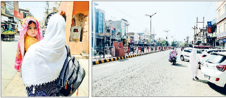
फतेहाबाद। भीषण गर्मी से बचाव के लिए बच्चों को ढक्कर ले जाती महिला तथा भीषण गर्मी में सुनसान पड़ा नेशनल हाइवे।