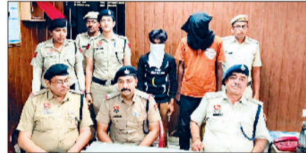
फतेहाबाद। पुलिस द्वारा गिरफ्तार वाहन चोरी के दोनों आरोपी व वाहन चोरों से बरामद किए गए मोटरसाइकिल।