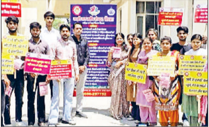
सिरसा। वन स्टॉप सेंटर का निरीक्षण करते विद्यार्थी।