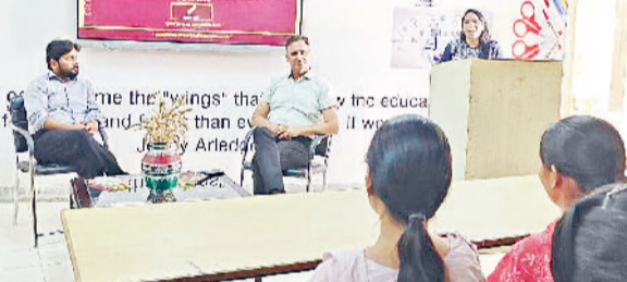
सिरसा। पुस्तक दिवस पर आयोजित कार्यक्रम को संबोधित करते वक्ता।

सिरसा। हरियाणा में गर्मी की शुरुआत होते ही बिजली संकट ने गंभीर रूप ले लिया है। प्रदेश के कई हिस्सों में लंबे-लंबे बिजली कट लगाए जा रहे हैं। कभी मटेनेंस के नाम पर तो कभी अन्य कारणों का हवाला देकर दिनभर बिजली आपूर्ति बाधित रहती है, जिससे आमजन, किसान, व्यापारी और विद्यार्थी सभी प्रभावित हो रहे हैं। सिरसा की सांसद कुमारी सैलजा ने इस स्थिति पर चिंता व्यक्त करते हुए कहा कि भारतीय जनता पार्टी की सरकार ने हर घर सोलर और बिजली बिल शून्य जैसे नारों से जनता को भ्रमित किया है। जमीनी सच्चाई इसके बिल्कुल विपरीत है, जहां लोगों को भारी बिजली कटौती और बढ़े हुए बिलों का सामना करना पड़ रहा है। उन्होंने कहा कि सरकार एक ओर सोलर ऊर्जा को बढ़ावा देने के दावे कर रही है, वहीं दूसरी ओर अपने घरों पर सोलर सिस्टम लगाए हैं, उन पर भी फिक्स चार्ज के नाम पर आर्थिक बोझ डाला जा रहा है।