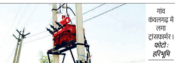
गांव कंवलगढ़ में लगा ट्रांसफार्मर।

क्षेत्र के गांव कंवलगढ़ में बिजली आपूर्ति व्यवस्था लंबे समय से चरमराई हुई है। ग्रामीणों को बिजली विभाग की कथित लापरवाही के कारण भारी परेशानियों का सामना करना पड़ रहा है, जिससे आम जनजीवन और खेती-किसानी दोनों प्रभावित हो रहे हैं। ग्रामीणों का आरोप है कि गांव में लगे पुराने ट्रांसफार्मर पर अब तक रिक्च नहीं लगाए गए हैं। इसके अतिरिक्त, लगभग एक साल पहले गांव में एक