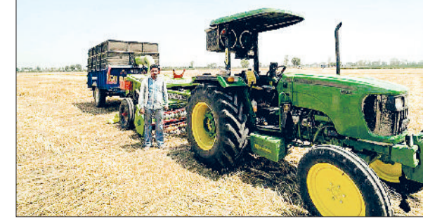
फतेहाबाद। गेहूं कटाई करते किसान।